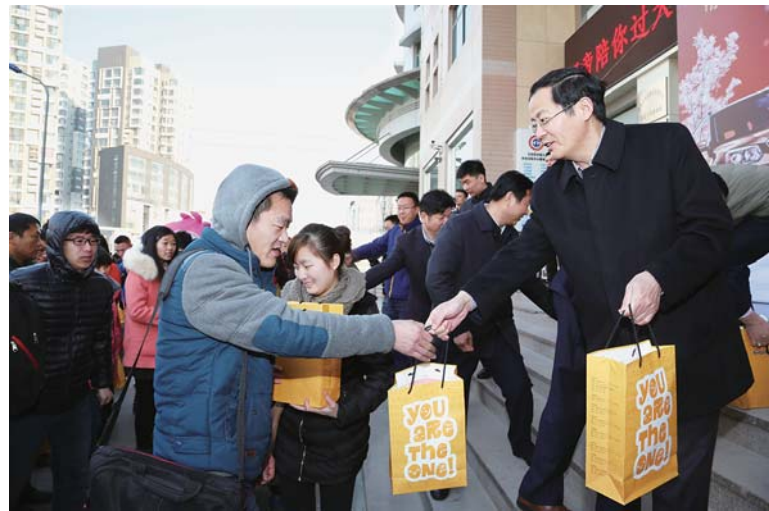
△爱心公益车免费送农民返乡过年，发放旅途食品