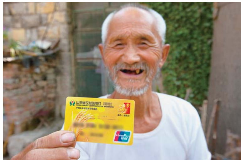
△城乡居民养老保险实现了“村村通”，参保农民不出村就能领取养老金

“人社部门的服务对象是面广量大的人民群众，检验工作的成效如何，关键在于人民群众的评价。在服务人民群众过程中，由于受政策、条件等因素制约，我们难以满足对象的所有诉求和愿望。但是，让服务对象对我们的工作态度、工作效率、工作质量、工作作风等感到满意，这是通过主观努力完全能够做到的。为了教育引导干部职工增强服务意识，提高服务效能，带着党性、责任和感情真心实意为群众搞好服务，我们在2012年提出了建设‘温暖人社’的主题目标，目的就是努力通过我们的工作，让前来办事的群众感受到人社部门的温暖，进而把党和政府的温暖送到千家万户，送到老百姓的心坎上。”在采访中，济南市委组织部副部长、市人社局局长蒋晓光这样解释建设“温暖人社”的初衷。