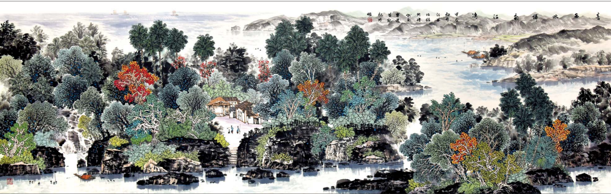
阮江华 春风吹拂南江湾 310cm x 97.5cm

由大众报业集团、海南日报报业集团、山东省文联、海南省文联、山东省美协、海南省美协共同主办，山东新闻书画院承办的“写意海之南——阮江华山水画全国巡展(济南)”于11月21日上午10点在山东新闻美术馆隆重开幕。此次展览的举办