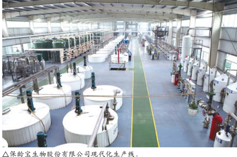
△保龄宝生物股份有限公司现代化生产线。