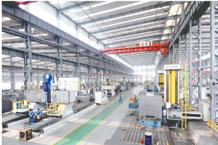
△迈特力重机有限公司现代化生产车间。