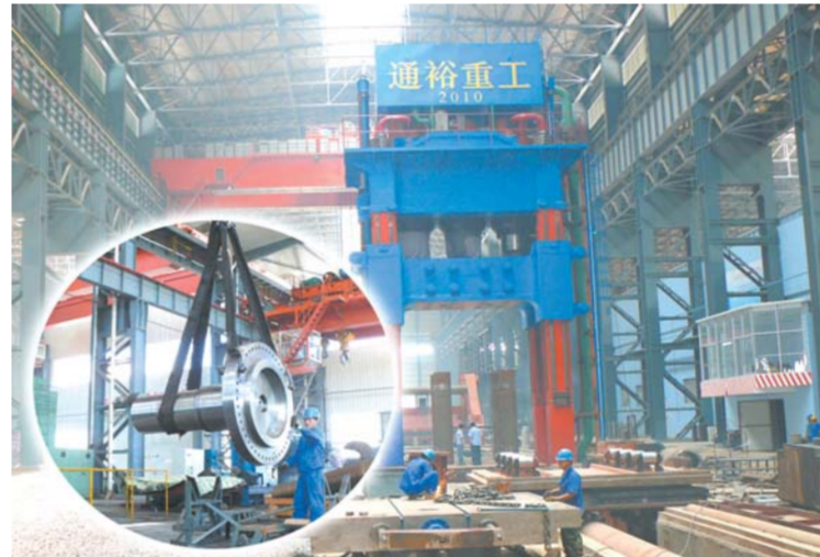
△通裕重工公司1.2万吨锻造油压机，是全国第四家、山东第一家万吨压机。