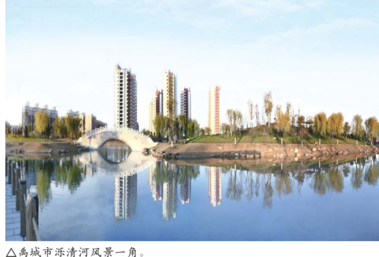
△禹城市沂清河风景一角。