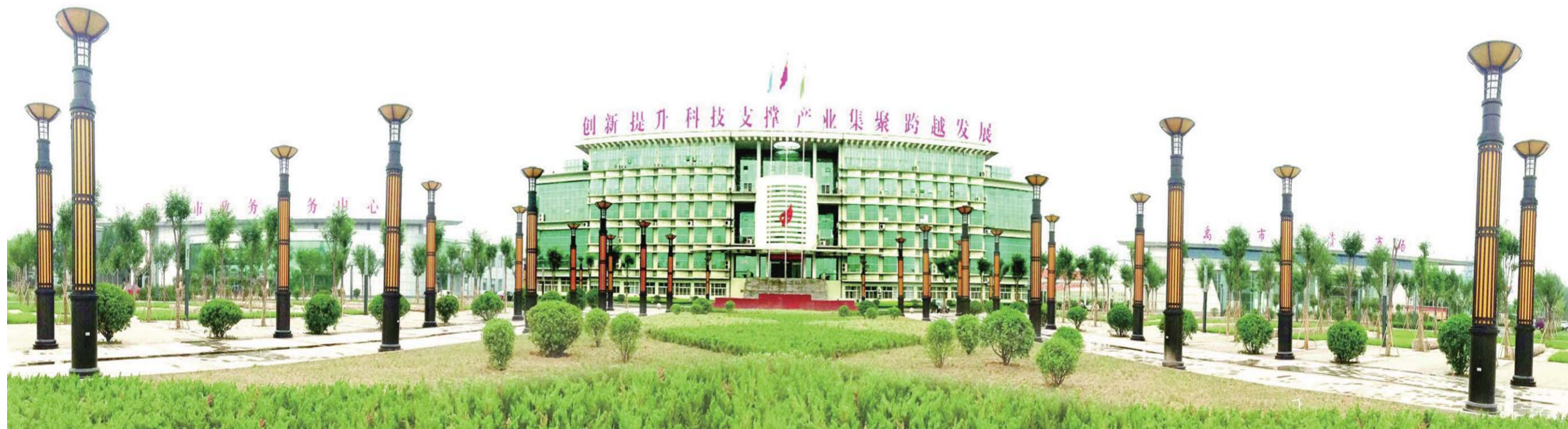
△9月29日，德州高新区晋升国家级，成为全省唯一一设在县级(禹城)的国家级高新区。图为德州高新区办公大楼。