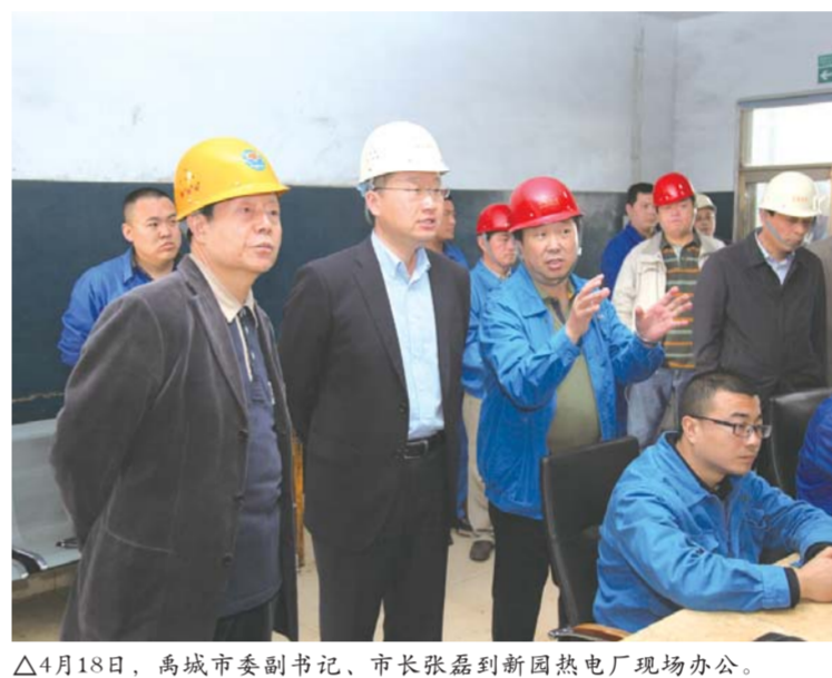
△4月18日，禹城市委副书记、市长张磊到新园热电厂现场办公。