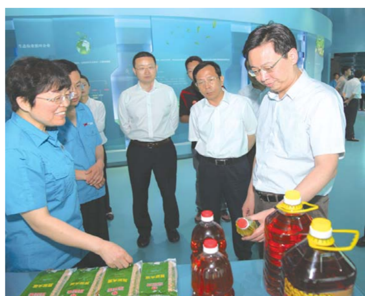
△5月30日，禹城市委副书记、市长张磊到德州高新区禹王集团检查指导工作。