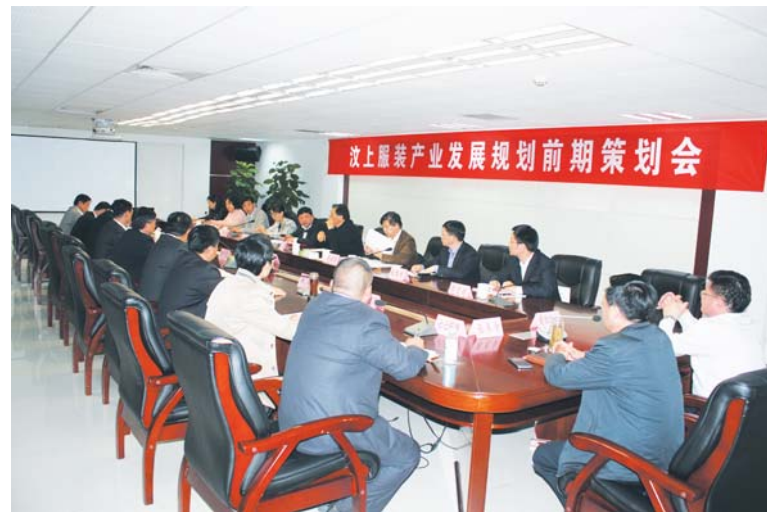
△行业内专家齐聚汶上共商汶上服装产业发展“十三五”规划