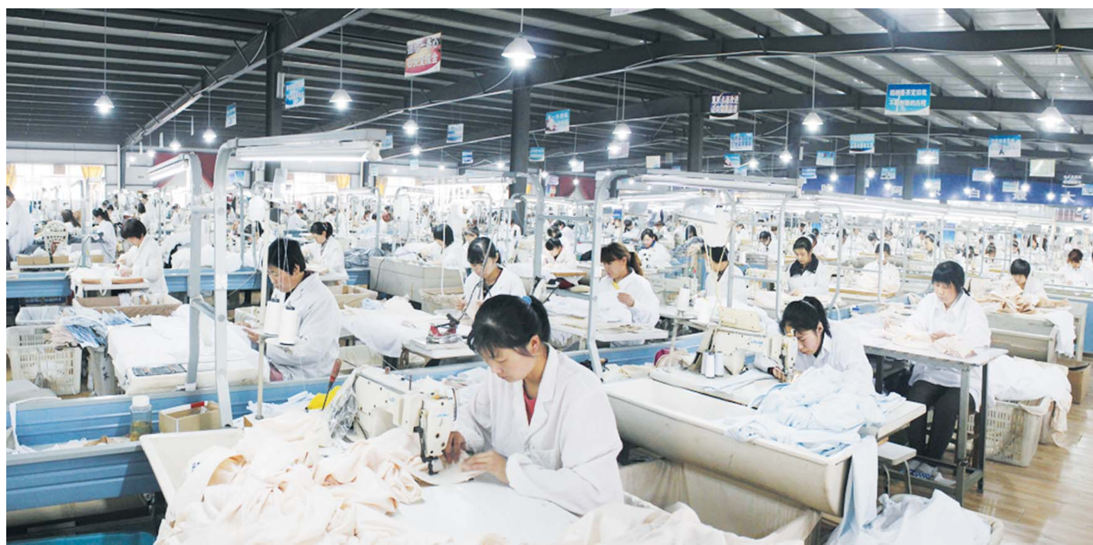
△汶上纺织服装企业总数达300余家，爱丝制衣、亚鲁服饰等25家企业员工人数超过千人。图为济宁阿尔白服装公司生产车间

班牙ZARA、德国阿达迪斯、美国CK、GUESS、耐克、丹麦杰克琼斯，以及劲霸、利郎、海澜之家、波司登、特步等国内外众多知名品牌的重要加工基地，每年生产10亿件服装。在打响自主品牌上，汶上县服装企业已经小有名气。包括ALBAI、如意、红玉兰、晨姿等一批自主品牌产品已经投放市场，其中ALBAI阿拉伯袍在全球中、高端阿拉伯袍市场份额达到11%，如意、红玉兰等已成功申报山东名牌。