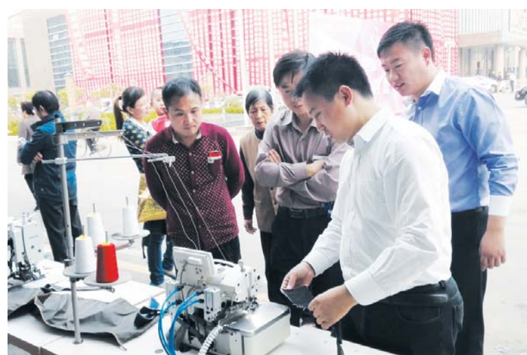
△2015第二届中国·汶上服装展览会上举办服装智能设备展览