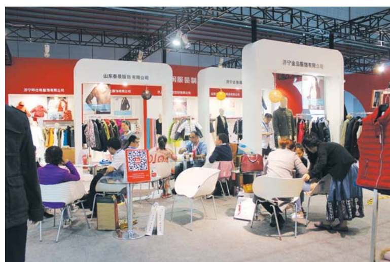
△2015 CHIC上海秋季展会上汶上展馆吸引大批中外客商