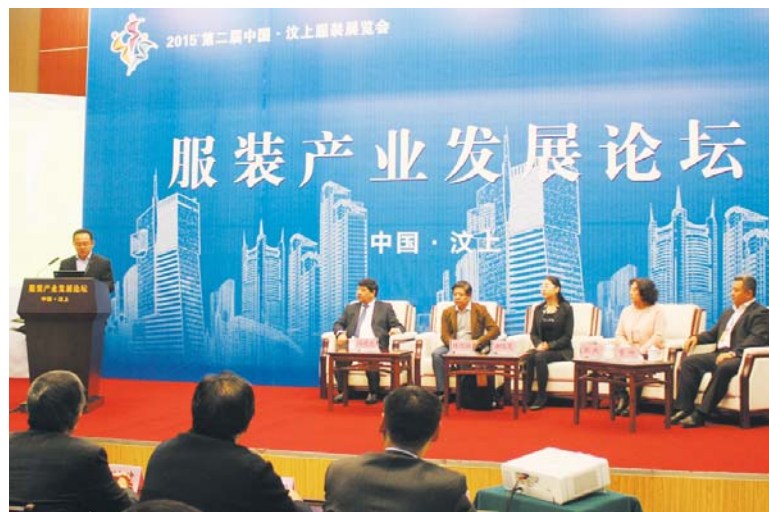
△2015第二届中国·汶上服装展览会上举办服装产业发展论坛