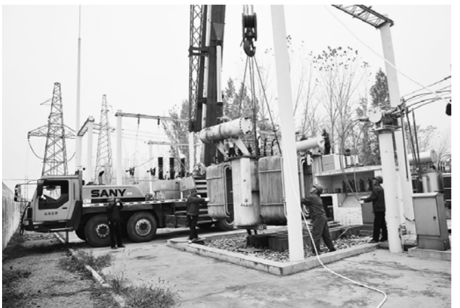
□李庆瑞 报道 随着用电量的剧增，张楼站原有的主变已难以满足用电负荷日益增长的需求。为提高电网可靠率，更好服务和满足当地居民生活与企业生产用电需求，国网成武县供电公司决定把2号主变更换为容量1万千瓦的主变。图为11月6日，成武供电公司完成35千伏张楼变电站主变的更换工作，并投入运行。

该所对辖区内的配电线路存在的树障进行了全面认真的排查，并出动大量人员清除线路两侧的安全隐患，做到隐患不留死角。同时，该所还积极开展电力法律法规及安全用电方面的宣传工作，大力宣传清除线路障碍的重要意义，为线路安全运行保驾护航。