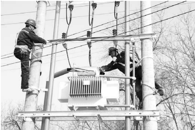
□李晓华 报道 11月10日，在单县李田楼镇杨大庄村、杨集村等10多个村庄，国网单县供电公司农网改造升级工程施工人员正顶着寒风加紧施工。年底将近，该公司组织了200余人的施工队伍，开展农网改造升级工程大会战，确保完成全年农网升级工程任务。