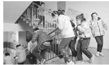
□张蓓 袁崇福 报道 11月9日上午9时，潍坊滨海实验小学组织1500余名师生进行消防疏散演练。

为落实全县家庭教育工作计划，深入推进全县家庭教育工作，帮助家长解决家庭教育中的困惑，提高广大家长育人水平，今年5月份，临朐县教育局推出了“父母大讲堂”教育惠民系列公益讲座活动，一期一个主题。