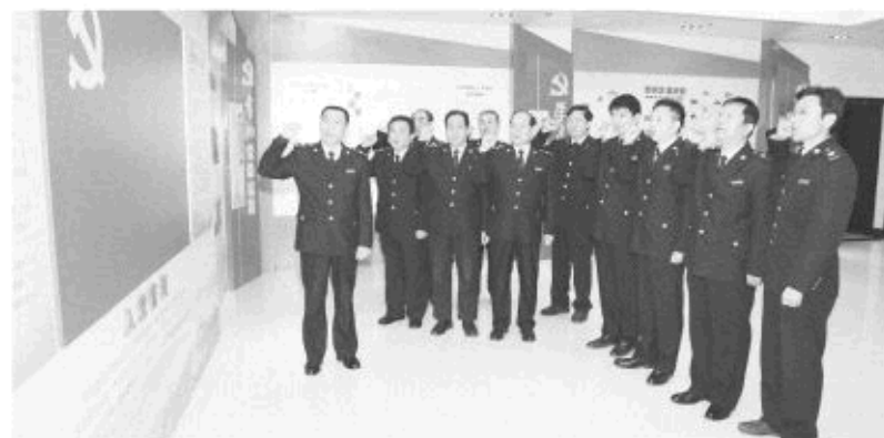
△发挥党建引领作用，抓好基层党组织活动

二是注重线索收集。对执法风险、不正之风、“慵懒散奢冷拖浮”、为官不为等影响地税安全和荣誉的问题，强调拉耳朵，听到不良信息及时核查，及时决策，及时纠正；瞪大眼睛，发现不良苗头及时提醒，发现不良行为立刻制止；铺下身子，加强与地方纪检监察、公安及新闻媒体的联系，获取案件线索，早发现，早纠正，防止小问题演变成大问题。