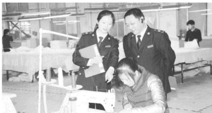
△深入企业开展个性化帮扶活动

一是注重廉政教育，增强廉洁奉公意识。把廉政教育作为培养全局干部职工树立廉洁奉公意识的直接有效手段，通过主题教育、警示教育等多种方式认真开展廉政建设教育，组织干部职工观看反腐倡廉教育片、违法违纪案例分析，做到警钟长鸣，通过学习党风廉政建设各项规定，列举和分析由于不廉而最终导致犯罪的成因，教育广大干部自觉做到廉洁自律。