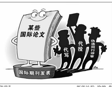
“代劳” 新华社发 徐骏 作

今年以来，百余篇国际论文轮番被撤，刺痛着中国学术界的颜面和神经。出版方给出的理由是“发现第三方机构有组织地为这些论文提供了虚假同行评审服务”。 经有关部门调查，一条代写、代投、伪造同行评审的国际论文“一条龙”服务灰色产业链浮出水面。涉事作者也受到严厉查处。 不少专家也指出，中国科学界的学术不端并非主流，不能因撤稿否定我国科研水平的总体提升和对世界的贡献。