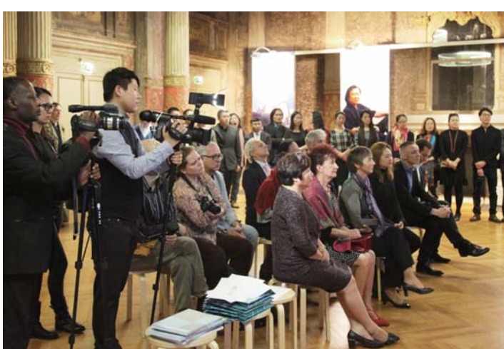
△开幕现场的记者方阵