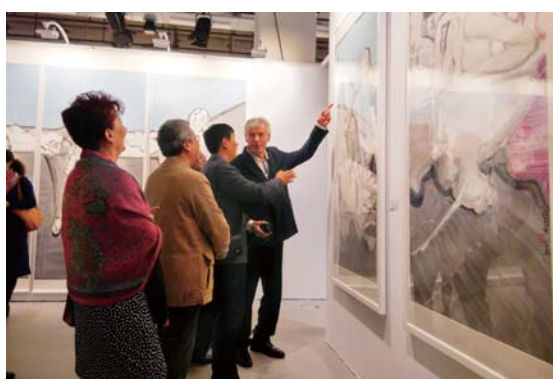
△法国艺术家观摩张望作品