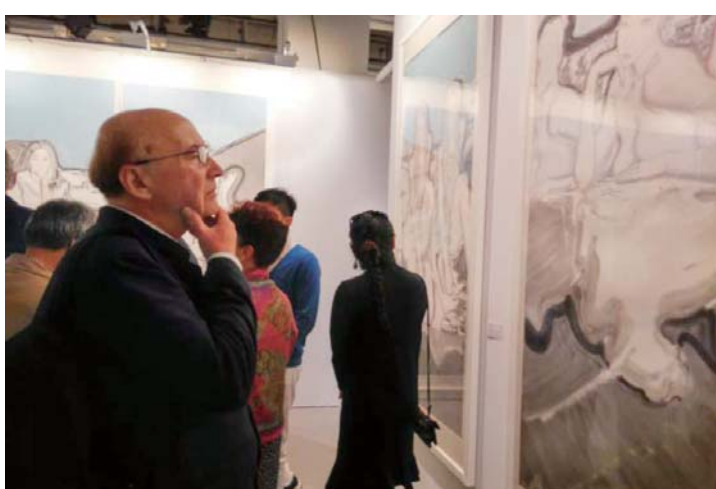
△法国友人凝思张望水墨艺术