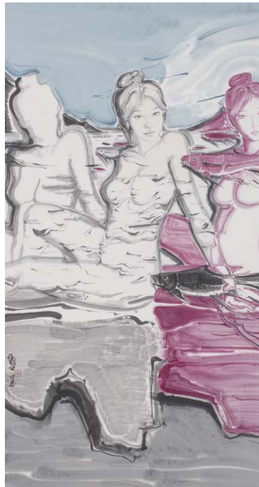
△影子系列《鱼·鱼》水墨纸本 97×180cm 2015年