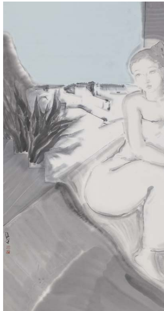
△正午系列之七《暖阳》水墨纸本 68×136cm 2015年