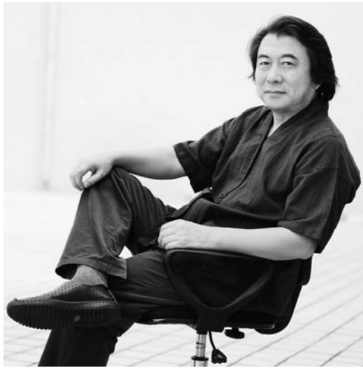
△张望，中国美术家协会会员，山东省中国书画学会副会长，山东美协中国人物画艺委会副主任，山东师范大学美术学院教授、副院长，山东师范大学当代水墨艺术研究中心主任，中央美术学院、中国艺术研究院国画院客座教授。

2015年10月5日的巴黎秋雨不歇，这本是闭门宅暖的“好时光”，巴黎各界名流却要冒雨齐聚盖利瑞克博物馆，为的是能享受一场来自中国的水墨艺术视觉盛宴——“视觉中国·吃象——张望巴黎水墨艺术展”。这场由中国文化传媒集团、法国巴黎盖利瑞克博物馆主办，《艺术市场》杂志社、法国当代艺术家协会等机构承办，国际著名艺术评论家、策展人艾玛纽埃尔·林科为法方策展人的展览，共展出了张望近年创作的73幅水墨精品，开幕式于巴黎当地时间晚18时正式拉开帷幕。