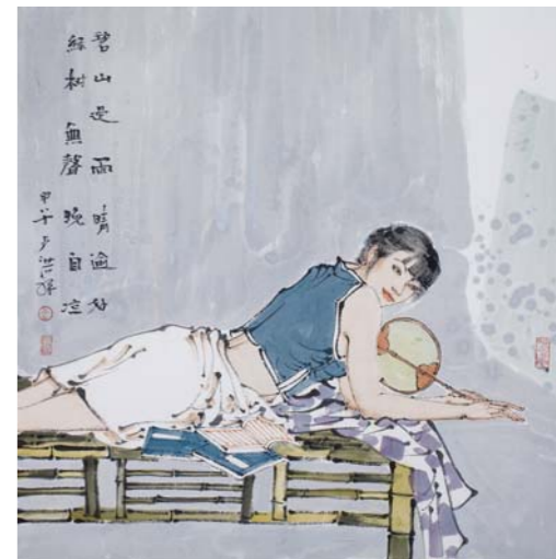
碧山过雨晴逾好，绿树无风晚自凉。