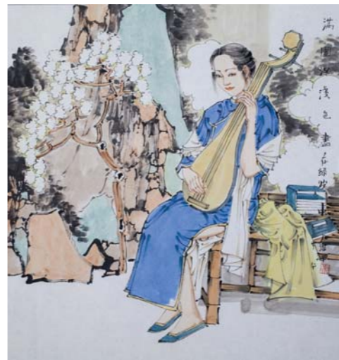
满园深浅色，尽在绿波中。