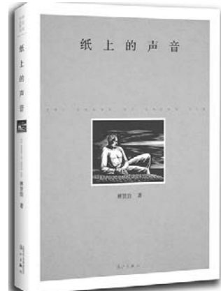
《纸上的声音》 林静 著 漓江出版社

本书精选了其一生的散文、杂文、演讲等内容,分别从教育与成功、信心与反省、不朽与人生、容忍与自由等方面阐述他的思想和观点,这些思想不仅在当时影响深远,在现代仍然具有现实意义。