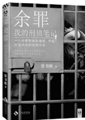
《余罪：我的刑侦笔记》 常书欣 著 海南出版社

通过对多位西方著名知识分子的叙述,探讨知识分子与国家、社会、革命、历史诸关系,解析作为理念人和实践者的知识分子的价值观念与人格建构。其中,对于中国“国民性”及现代作家“精神还乡”问题的阐述,寓褒贬于历史观照之间,视域开阔,观点鲜明,创见迭出。