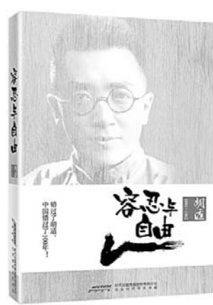
《容忍与自由》 胡适 著 北京时代华文书局

本书精选了其一生的散文、杂文、演讲等内容,分别从教育与成功、信心与反省、不朽与人生、容忍与自由等方面阐述他的思想和观点,这些思想不仅在当时影响深远,在现代仍然具有现实意义。