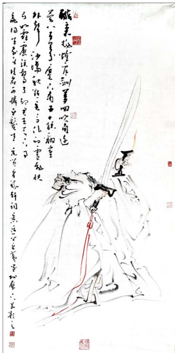
韦辛夷 稼轩词意图