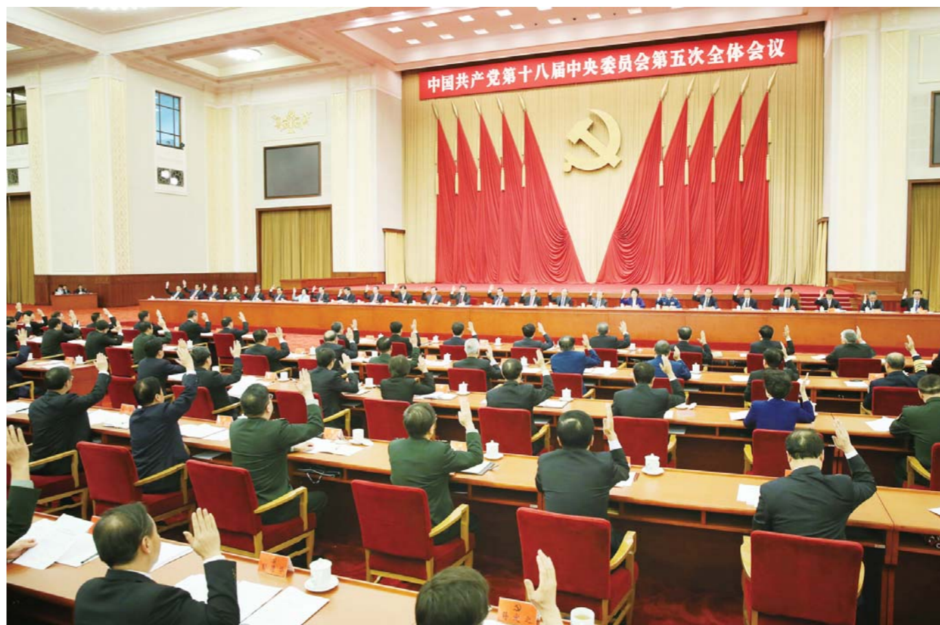
中央政治局主持会议。