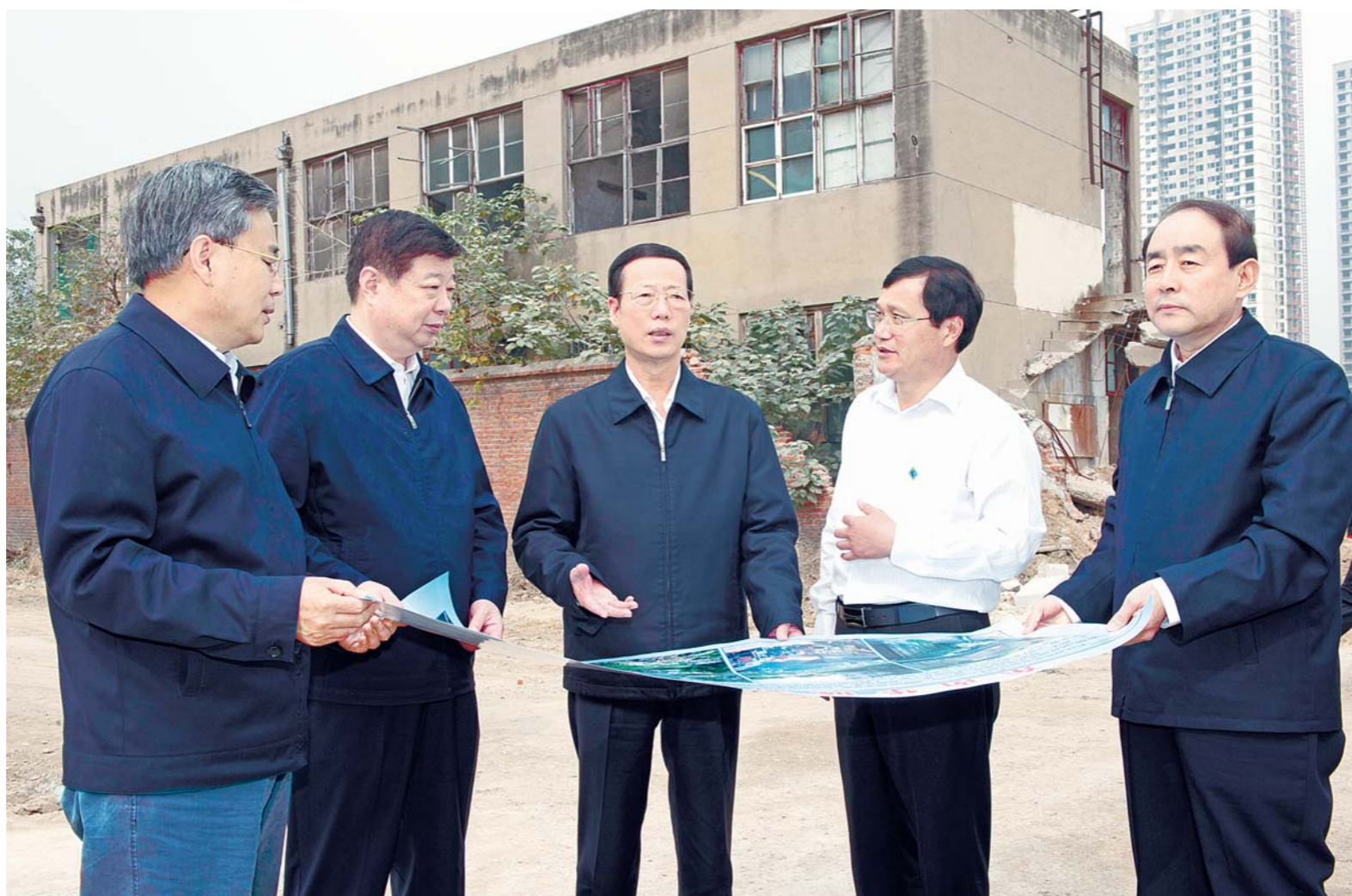
10月22日,中共中央政治局常委、国务院副总理张高丽到济宁市东南华城调研东南片区还迁安置区暨东南华城棚户区改造项目。省委书记姜异康,省委副书记、省长郭树清陪同。

张高丽强调,“十三五”规划要把扶贫开发工作摆上更加突出的位置,切实增强历史使命感和责任感。要坚持精准扶贫基本方略,因地制宜实施扶贫攻坚行动计划,切实做到扶持