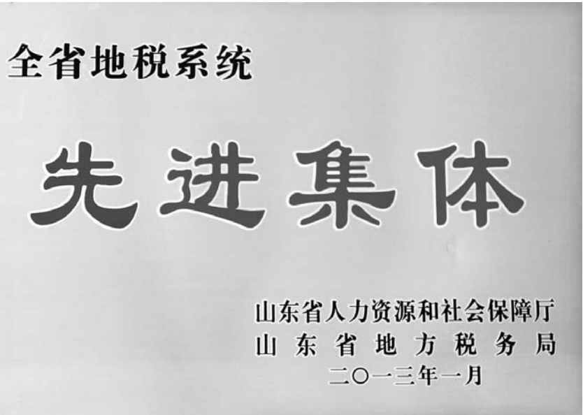
△全省地税系统先进集体