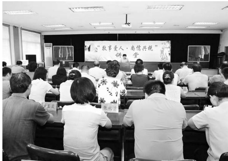
△举办高密地税“敬事爱人·尚儒兴税”讲堂