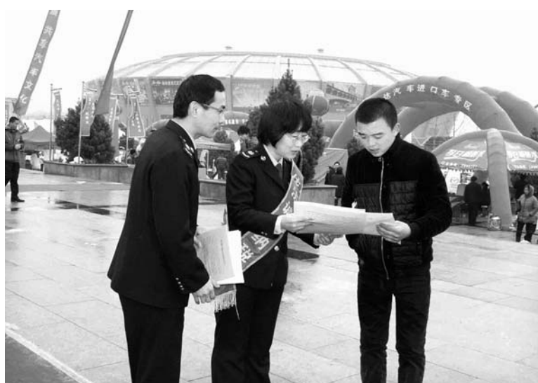
△举办办税厅宣传进车展活动