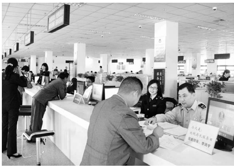
△开展“地税局长服务日”活动