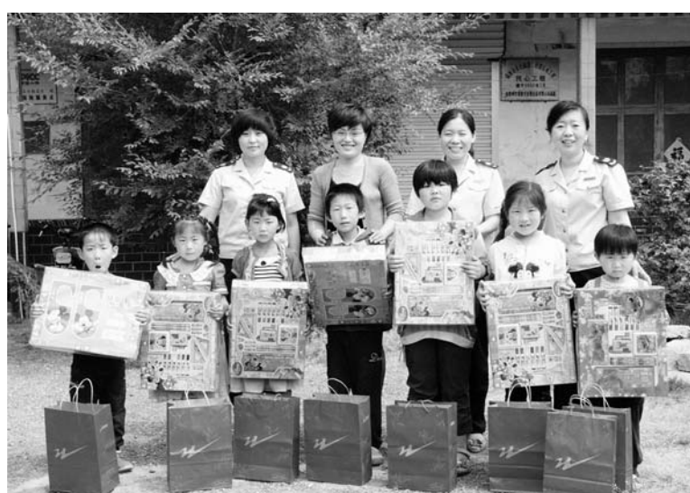
△六一儿童节期间，看望慰问“春蕾儿童”