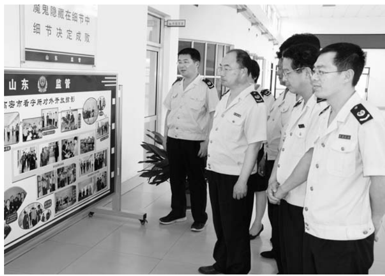
△组织干部职工参观看守所，接受警示教育

润税促使地税事业蓬勃发展。“学思结合”、“知行合一”是手段，“敬事爱人·尚儒兴税”是目的。要丰富手段，才能达到良好目的。