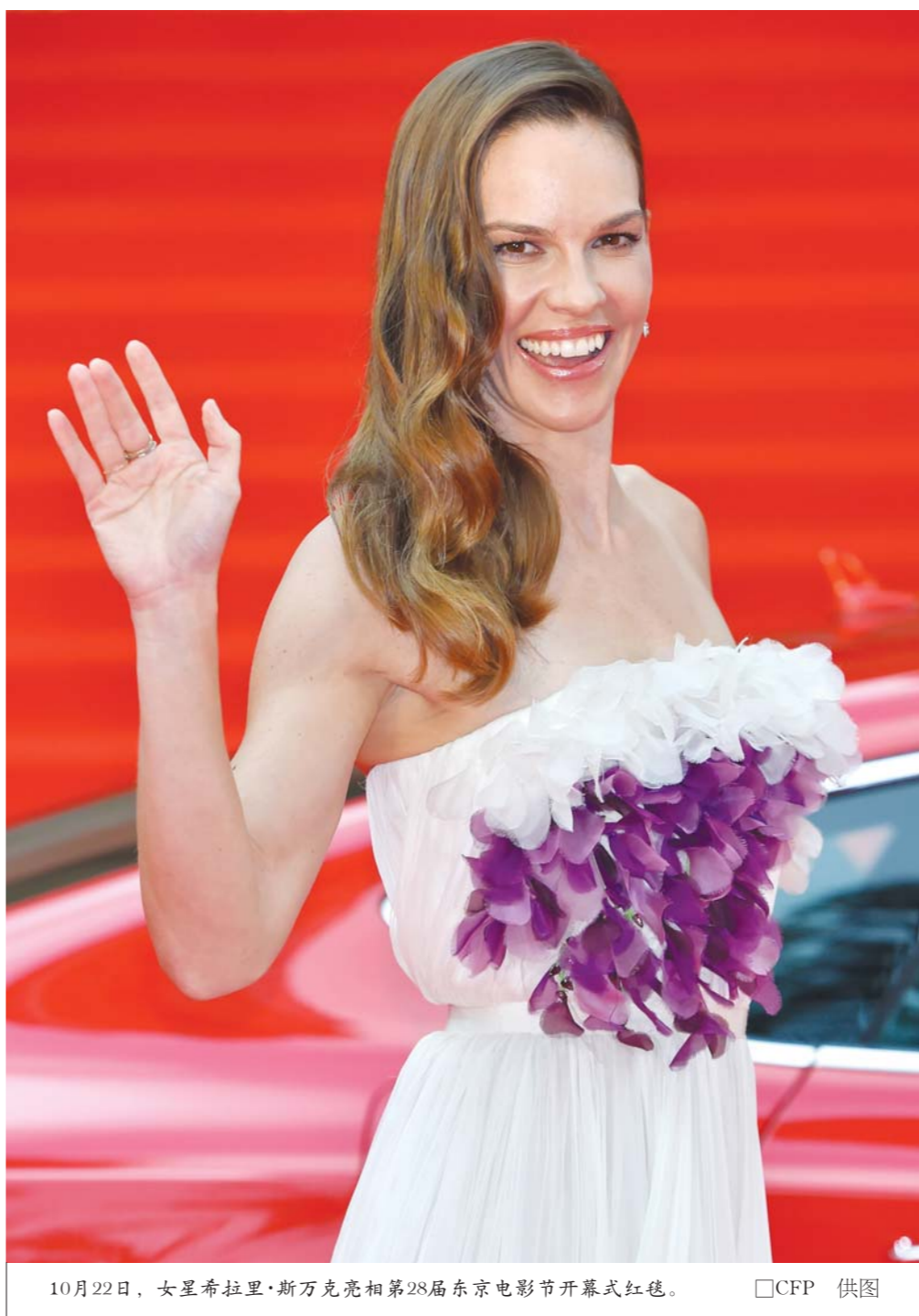
10月22日,女星希拉里·斯万克亮相第28届东京电影节开幕式红毯。

当然,随着《伪装者》、《琅琊榜》等剧的热播,一批中年“老干部”特质的高颜值实力派演员正在崛起,从而为呈板化的电视剧演员市场提供了新的选择空间。除了靳东的《浮出水面》、祖峰的《双刺》、王凯的《青丘狐传说》,张鲁一也有《麻雀》、《马上天下》等新剧等待上线。从这几部剧可以发现,“国剧四美”的主打剧目仍是谍战剧,明年他们或将成为新一代的“拟请神兽”,剧作类型也或将拓宽。