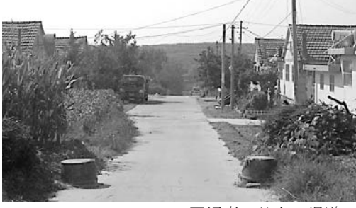
图为上朱兰村北的石墩。它阻断了校车通往北唐家庄的可能。

关于设立石墩的初衷，北唐家庄村民认为是两村矛盾所致。而上朱兰村则认为大车经常北上，为了保护道路，只能如此。