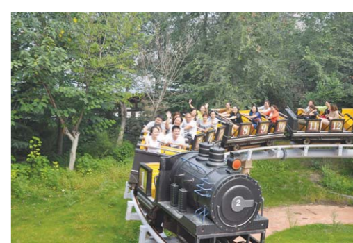
□ 记者 郑莉 通讯员 郭浩芳 报道 9月10日教师节，泰安方特欢乐世界联合泰安市委宣传统战部举办“饮水思源·师恩回馈”大型教师节公益活动，邀请泰城约50名教学优秀的教师在节日里免费畅游方特，让他们以欢乐的心情迎接新学期的教学工作。 图为参加活动的优秀教师乘坐娱乐设施。

本次泰山国际登山比赛，中国移动优秀的网络质量、可靠的网络性能、细致的服务保障，给所有人留下了深刻印象，移动的风采再次通过央视这个大平台展现给了全国的电视观众。维护人员发扬“敢当”精神，出色完成了网络保障任务，也为完成国家级赛事保障任务积累了经验。