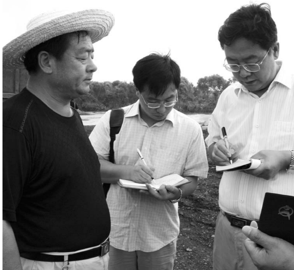
2007年8月，李昌文（右）在新泰华源煤矿事故现场采访。

◆ 个人简介：李昌文，1964年生，1987年毕业于南京大学中文系。曾任山东广播电视台副台长、高级编辑，现任中共济宁市委常委、宣传部部长。系全国文化名家暨“四个一批”人才，荣获中国新闻工作者最高奖“范长江新闻奖”，享受国务院政府特殊津贴，荣立省政府一等功1次、二等功4次，获评为“山东省优秀新闻工作者”“山东省劳动模范”。承担山东省社科理论重大研究项目《传播语言学及其理论体系建设》和中宣部资助项目《新闻之见》。