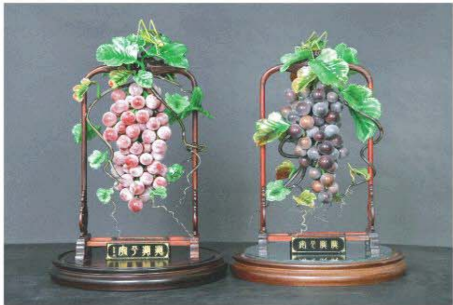
△灯工作品《岁岁平安》