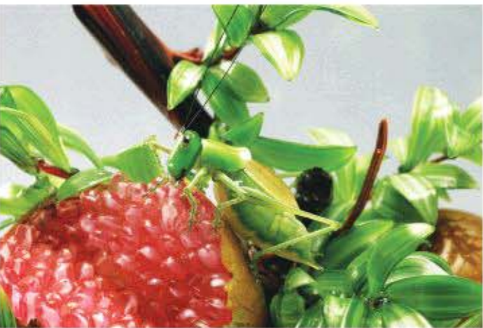
△灯工作品《众籽石榴》