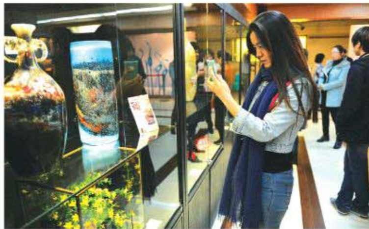
△在北京、上海等地举办的琉璃展览吸引了大量市民前来参观