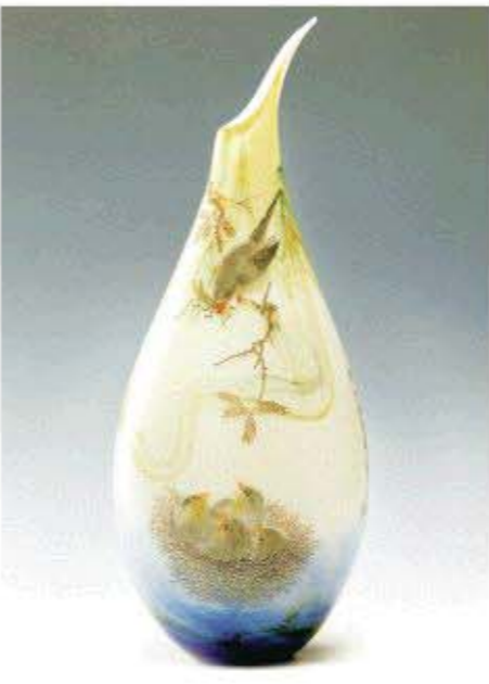
△琉璃微刻作品《劝君莫打枝头鸟》