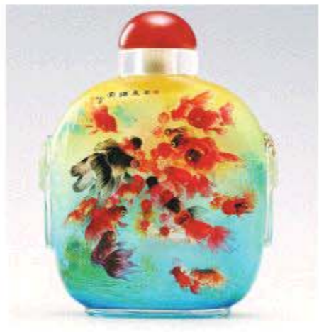
△鼻烟壶内画作品《金玉满堂》