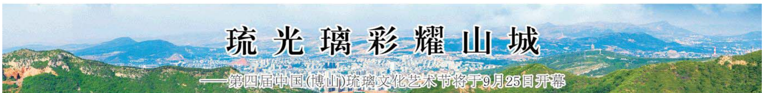
□马景阳 李安臣 苏兵

地，博山琉璃发展已有数千年历史，被誉为“中国琉璃起源地”，博山堪称一个“精雕细琢”、“琉璃璀璨”的魅力山城。今年，博山琉璃可谓喜事连连。在前不久结束的全国纪念抗战胜利70周年阅兵仪式招待晚宴上，“博山琉璃插花摆件”系列作品被摆放在国宴桌上；由博山西冶坊制作的“中国红琉璃梅瓶”等产品入选钓鱼台国宾馆；“中国琉璃葡萄架”荣誉称号花落博山；为