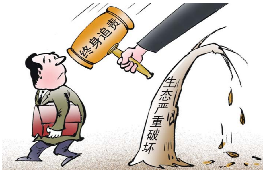
对生态环境损害负有责任的领导干部终身追责。