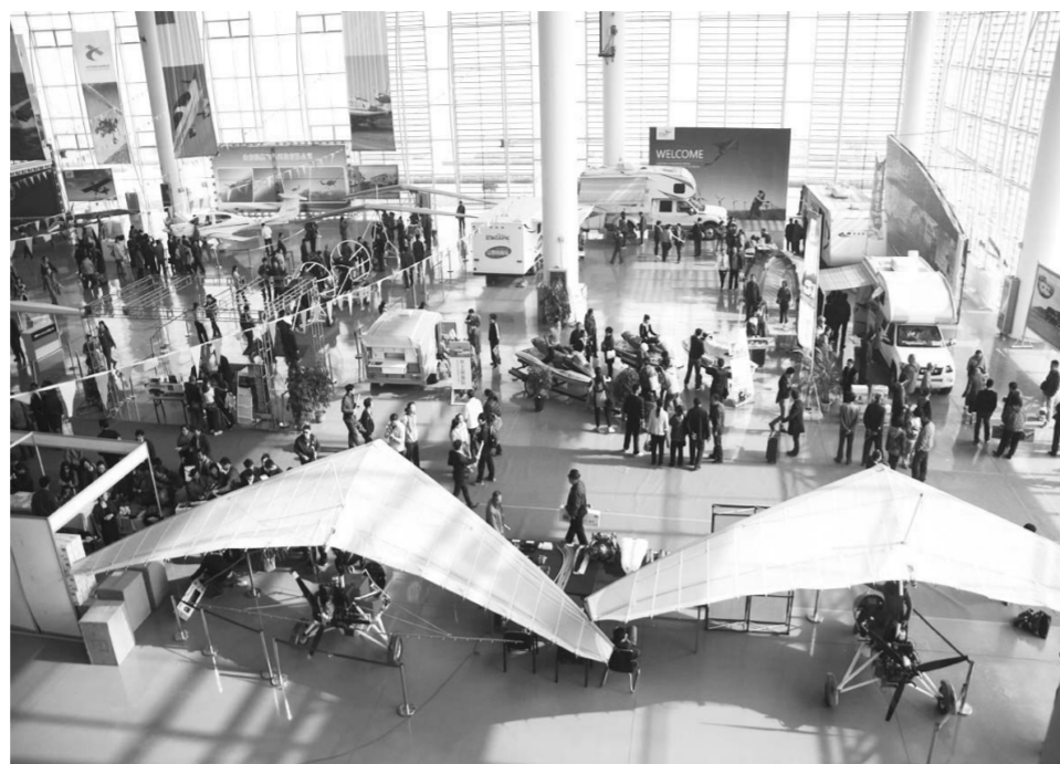
△每年一届的航空运动器材装备展览会

航空节和航空运动产业也因雪野清明透亮的山水而绽放出无与伦比的活力。有了雪野，有了航空节，航空运动就像有了根据地，全国乃至全世界的航空运动爱好者就像有了一个可以依靠的“家”。据中国国际航空体育节筹委会办公室的同志介绍，首届航空体育节给前来参加航空节的