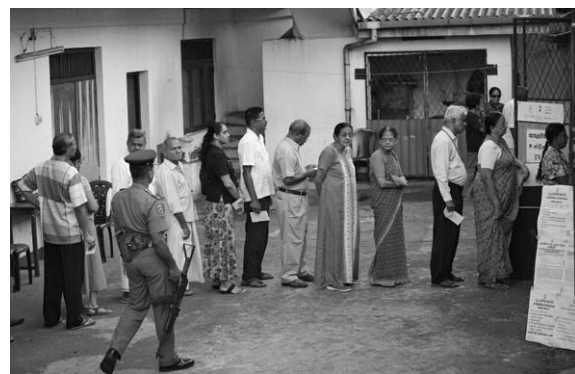
8月17日,在新西兰卡首都科伦坡的一处投票站内,选民们排队等待投票。 斯里兰卡17日举行议会选举,约1500万选民在平静的气氛中在全国22个选区进行投票。

据新华社广州8月17日电 广东省纪委17日下午通报,广东省工商行政管理局党组书记、局长朱泽君因涉嫌严重违纪违法问题,正在接受组织调查。