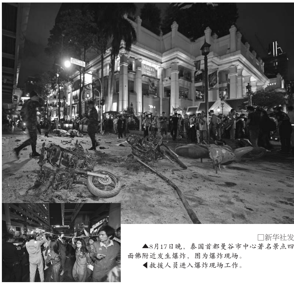
新华社发 8月17日晚,泰国首都曼谷市中心著名景点四面佛附近发生爆炸,图为爆炸现场。