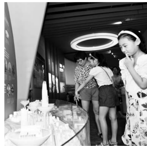
市民参观济南城市发展模型