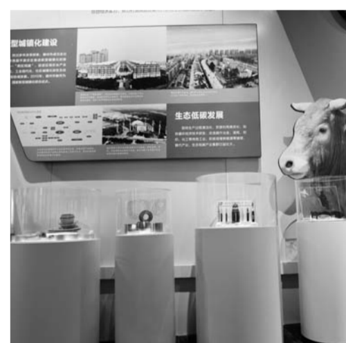
“西部经济隆起带”生态牧场展示区