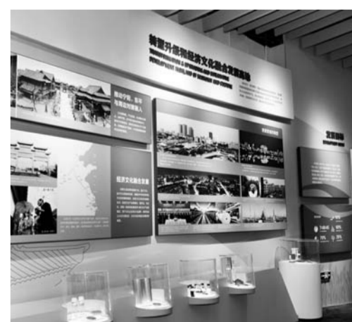
“转型升级和经济文化融合发展高地”板块展示区