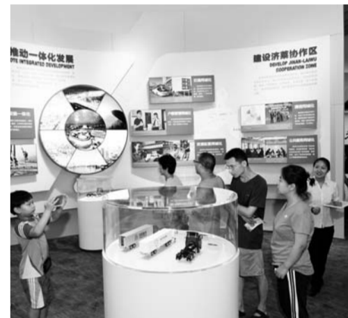
中国重汽卡车模型吸引了不少市民驻足参观