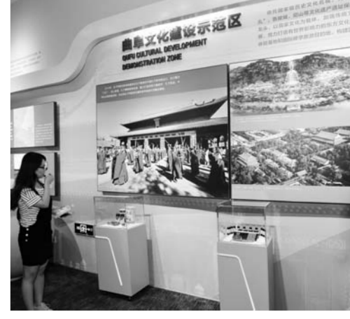
“首善之区”曲阜文化展示区示意图