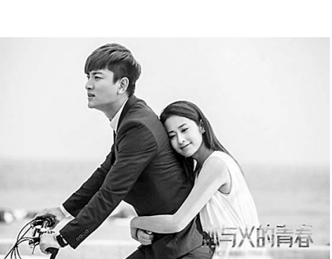
电视剧《冰与火的青春》剧照