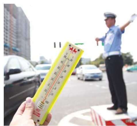
□ 记者 冯磊 报道

历下区交警大队以严管严控的高压态势督促重点车辆企业切实履行自身安全主体责任。此次交警大队通过开具5000元罚单以及对公司相关负责人和驾驶员进行深刻的安全教育，使其认识到大货车超载的性质严重性，以此引起运输企业高度重视，有效遏制货车超限超载运输违法行为。