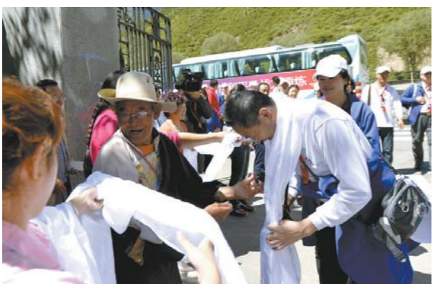
送医送药的志愿者无论走到哪里，都会受到当地群众的热烈欢迎。