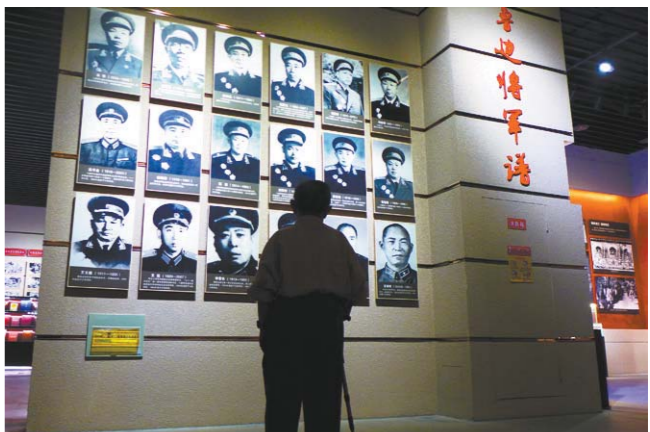
伫立在冀鲁边区抗日将领照片墙前，老人久久不肯离去。