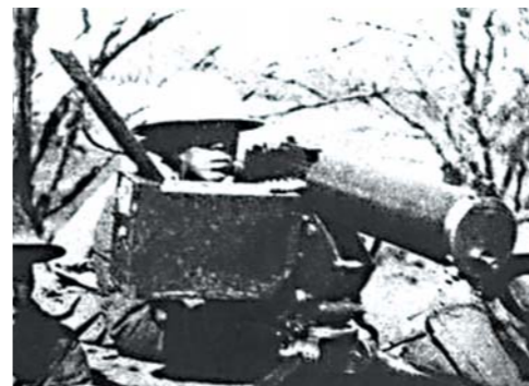
中国守军在台儿庄外圈阻击进犯的日军。