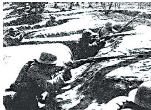
中国军队在临沂阻击进犯的日军。