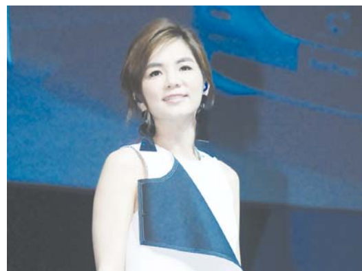
□新华社发 7月2日，台湾歌手陈嘉桦(Ella)在台北演唱新专辑歌曲。