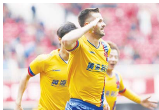
□新华社发 7月3日，中甲青岛黄海队外援格兰·戈基奇在球队训练后突然休克，失去意识，送往医院后医治无效死亡。 图为2015年4月18日青岛黄海队外援格兰·戈基奇在中甲联赛第五轮比赛中的资料照片。

作为1986版《黑猫警长》主题曲的原唱，沈小岑的代表作不仅只有这一首，上世纪80年代红遍中国的小小少年《请到天涯海角来》《哎哟妈妈》均由她演绎，1982年发行的唱片销量就已达到200万张，可见其爆红程度。