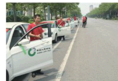
△东营国寿财险爱心送车车队

战略取得较好效果。2014年，该公司实现保费收入3.61亿元，其中，长险首年期标准保费5875万元，同比增长9%，长险首年期交保费