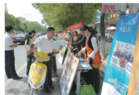
△东营国寿户外宣传活动

据了解，国寿东营分公司通过实施“万人大业”战略，在履行社会责任的同时，也为公司发展储备了高素质人才，已为高校毕业生、下岗分流人员、进城务工人员等各类人员提供