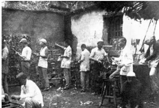
1944年大众日报在莒南县王家野哩的排版车间。