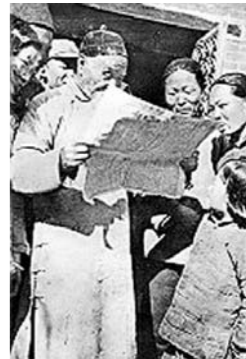
抗日战争胜利，群众争相阅读大众日报。