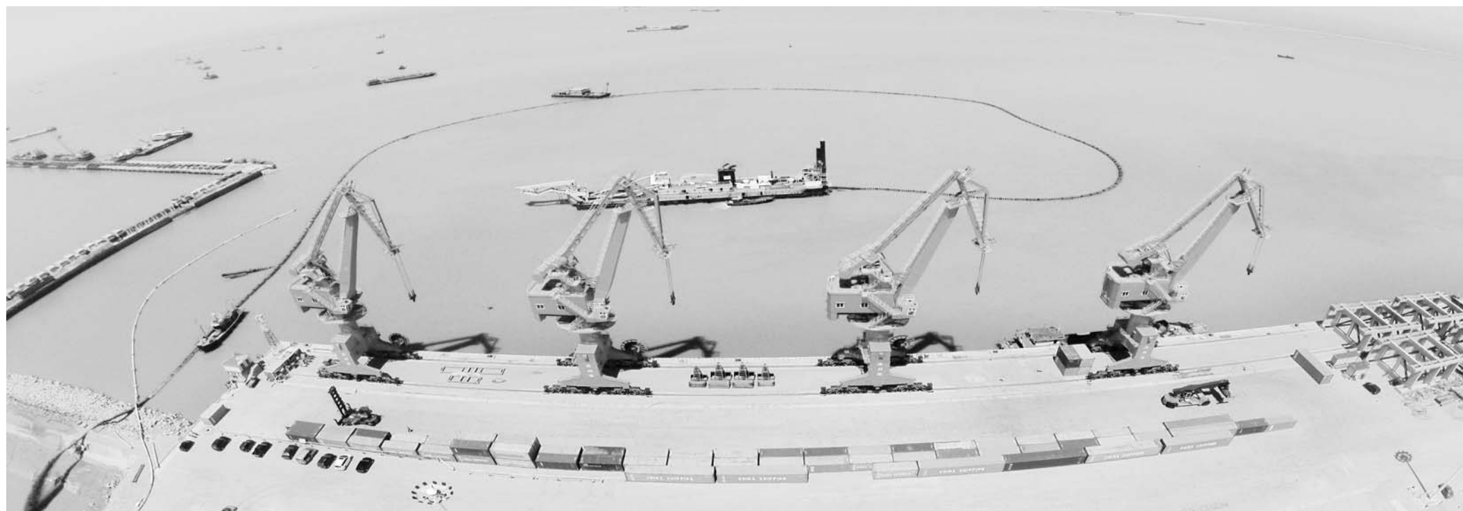
△滨州港2×3万吨级码头鸟瞰

黄河三角洲再添一3万吨级深水港口，济南都市圈唯一海港港口启航，山东省海上“北大门”就此打开，加速融入到国家“一带一路”建设和京津冀一体化发展的整体布局中。