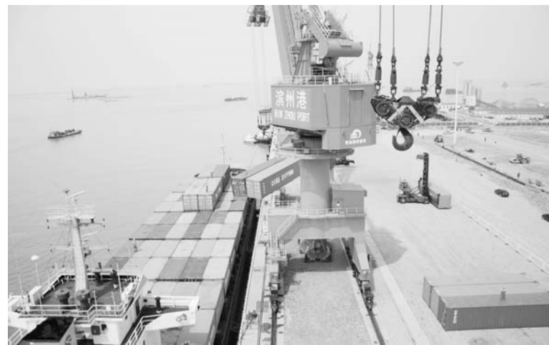
△2015年5月7日，远大和谐号顺利试靠泊