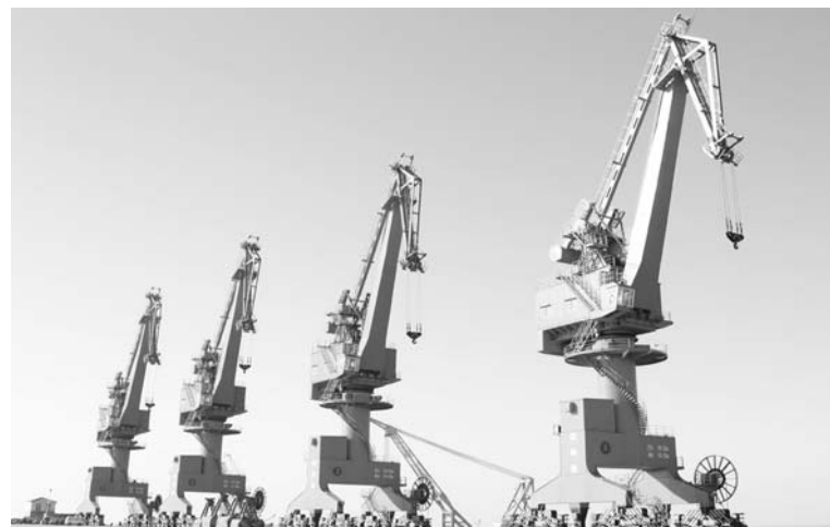
△严阵以待的龙门吊