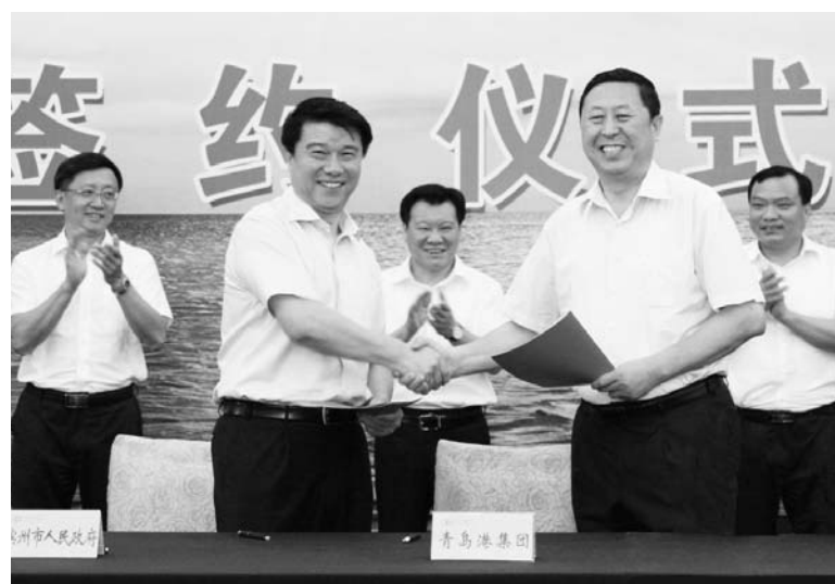
△2014年8月14日，滨州市人民政府与青岛港集团签约