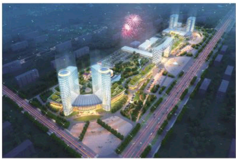
△健康养老产业成为昌乐县的六大新兴产业之一。图为该县大德·国际医疗中心效果图

“我们要按照‘敞开核桃’的要求,一个产业制定一套完善的推进体系,积极培植新的经济增长点。要加强对新业态、新技术、新概念的研究和运用,将大数据、云计算、互联网+等新理念融入到转型发展中。”昌乐县委书记张新强说。