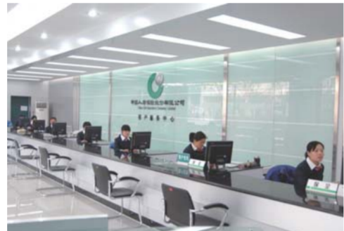
△莱芜国寿现代化的客户服务大厅

截至今年6月，该市共有保险机构25家(财产险公司13家、人身险公司12家)，比2014年增加三家保险机构。行业的发展催生机构的快速增加，并有效缓解就业压力，为地方经济建设