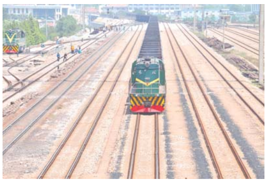
吕光社 栗晨皓 报道 日照港大宗商品吞吐量快速增长，铁路功不可没。