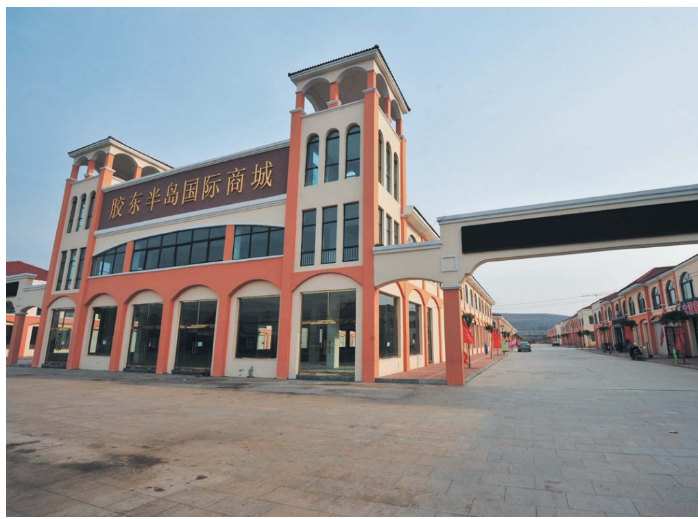
△胶东半岛国际商城

徐家店镇在项目启动上注重“快”，加快中石化储油基地、黄金冶炼二期等项目落户，在项目进度上注重“抢”，坚持“一切为了重大项目”，按照“一个项目、一套班子、一个方案、一抓到底”的推进机制，对落户项目实行周调度、月督查，力争项目早开工、早投产、早达效，形成全镇新的经济增长点。同时，加大招商引资力度，充分发挥全国重点镇、省级示范镇及青荣城铁通车的优势，在项目效果上注重“优”，主动对接高新项目，全力服务，敞开大门，力争引进更多投资大、效益高的大项目。