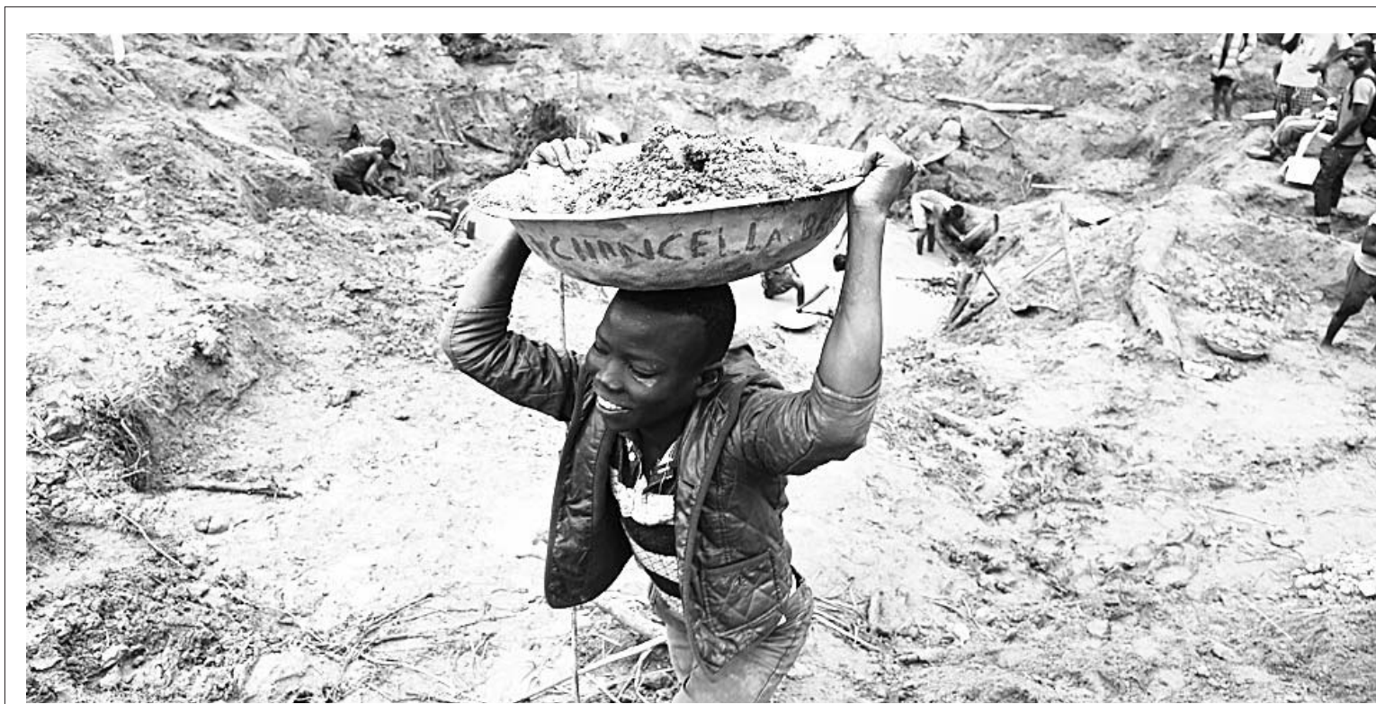
▲2014年5月5日,在中非共和国加姆村的一处金矿,一名小男孩头顶一盆沙土。

缅甸政府与果敢政府2009年在一场与今年相似的武装冲突后达成停火协议。今年2月9日,双方再度爆发冲突。