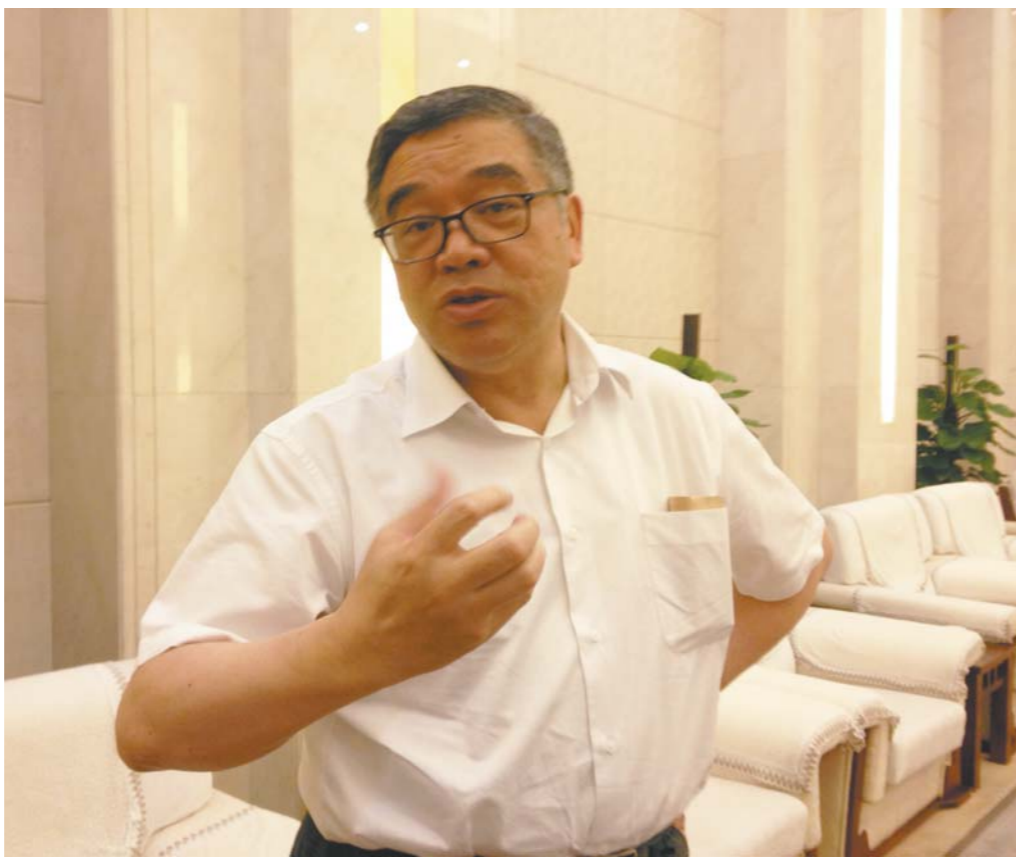
“一旦社会弥漫着书香，精神就会充盈着芬芳，这样的世界自然就是更为美好的世界。而这样的一个过程，将创造着新的历史。”朱永新接受本报记者采访时如此表述。