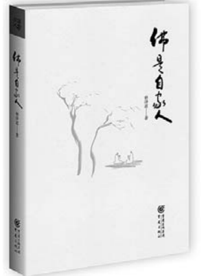
《佛是自家》 释泽道 著 重庆出版社

本书以油价大跌、卢布贬值、美俄石油斗争为背景，将中东战争、车臣战争、美苏争霸、苏联解体等重大历史事件与现今的乌克兰内战、克里米亚之争等时事热点串联起来，向读者解读事件背后的地缘、政治因素，详细介绍了近期乌克兰危机的由来，以及俄、美、欧之间的博弈和中国的石油发展战略。