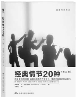
《经典情节20种》 [美] 罗纳德·B·托比亚斯 著 中国人民大学出版社

作者以佛经典故、历史故事、禅宗偈语等等，针对当下人们生活、工作中各种烦恼及困境，告诉读者如何调整心态积极面对，从而在自己的内心找到快乐的根源，增强获得幸福的能力。