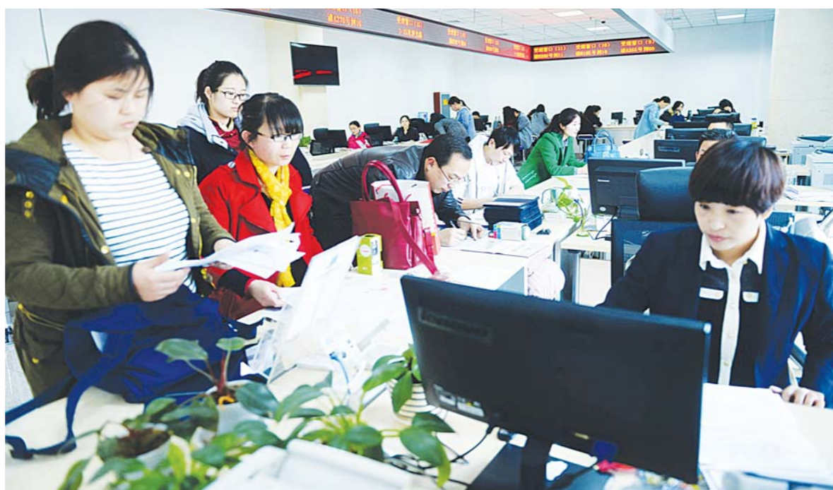
今年,青岛市在黄岛区试点实施“三证合一”办法,将原有的工商营业执照、组织机构代码证、税务登记证3个号码合并到一个营业执照上,使原本办理三个证件所需1个月左右的时间缩短至3到5个工作日。

从2013年开始,我省打响简政放权攻坚战,目前省级共取消下放行政审批事项400项,已完成五年削减任务的68%,各市也纷纷开启权力“瘦身”大幕,有效激发了社会和市场活力。 过去的两年,我省重点解决“审批多”的问题,着重在减量上下功夫。2015年是全面深化改革的关键之年,面对审批沉痾,今年我省重点向“审批难”亮剑,行政审批迈向“标准化”时代。