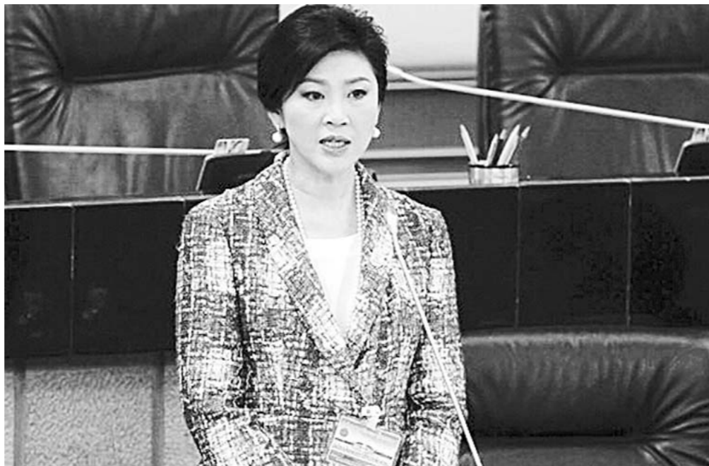
图为今年1月22日英拉在泰国国家立法议会现身,出席针对她的弹劾案的最后一轮听证。