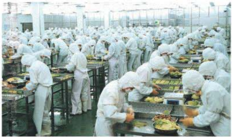
△食品工业莱卷车间

园管委会，并规划建设了食品工业园区。2014年，龙旺庄街道完成地方财政收入9062万元，出口创汇2.97亿美元，实际利用外资864万美元，合同利用外资900万美元，固定资产投资完成12.4亿元，农民人均纯收入13747元。