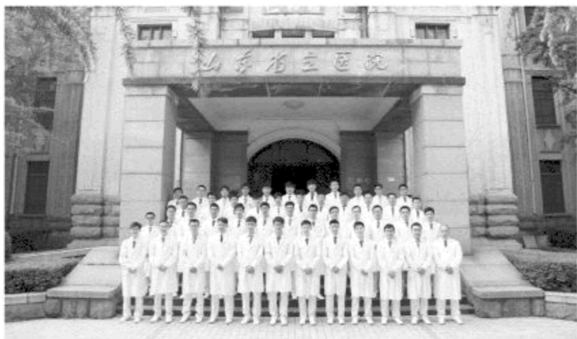
△山东省立医院天使男团

2003年7月21日,山东省立医院用它容纳百川的胸怀迎来了第一位男护士,用无限的包容与关怀呵护着这个新兴职业的成长。12年的时间,山东省立医院见证了男护士队伍从无到有,从小到大,从大到强的发展历程。12年来,一位位“男护士”的不断加入,使这支平