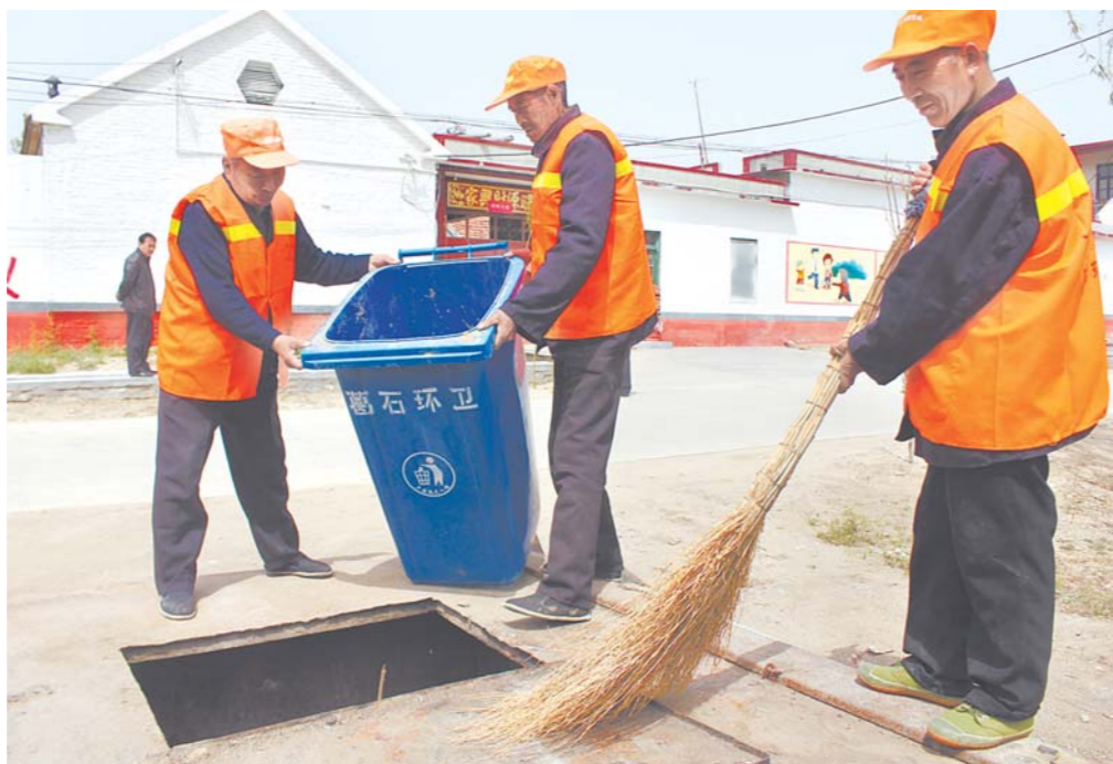
环卫工作市场化,让保洁员的肩上了压力和责任,工作效率和质量也不断提高(资料片)。

务中心负责对中标单位进行监督考核,根据考核情况按月拨付保洁费用。如果发现一处不达标,将视情况对保洁公司处以不同数额的罚款。