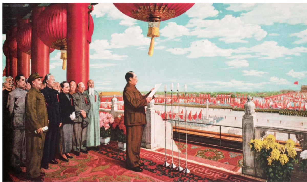
△董希文 《开国大典》 布面油彩 230×400cm 1954年修改 中国国家博物馆藏