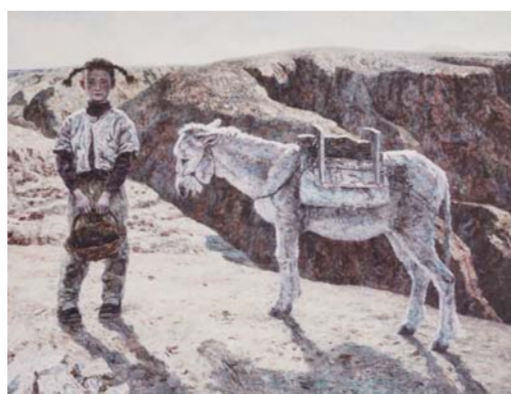
△孙为民 《西北风情·塬上》 布面油彩 110×140cm 2009年自藏