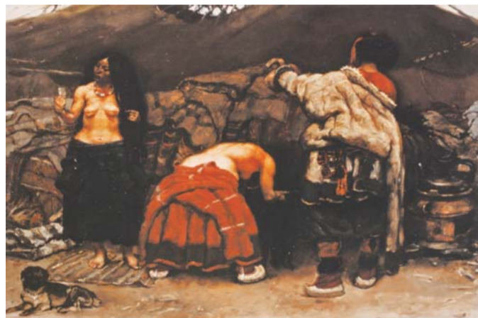
△陈丹青 《洗发女》 布面油画 54×68cm 1980年 中央美术学院美术馆藏