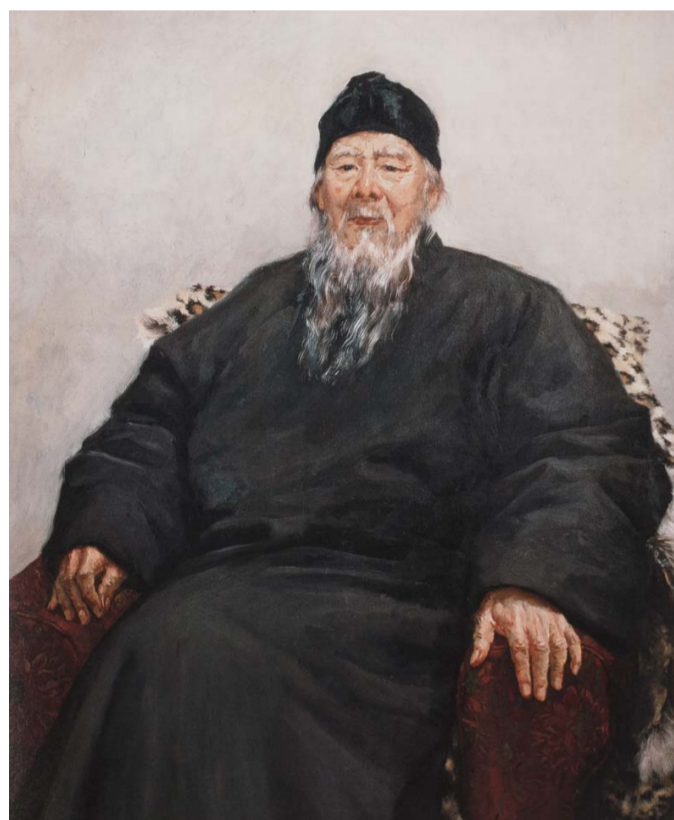
△吴作人 《齐白石像》 布面油画 113×86cm 1954年 中国美术馆藏