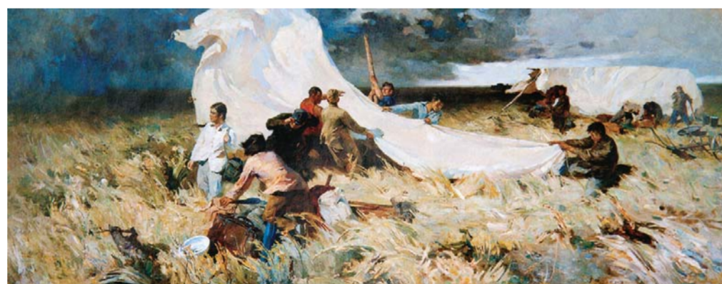
△詹建俊 《起家》 布面油彩 140×348cm 1957年 中央美术学院美术馆藏