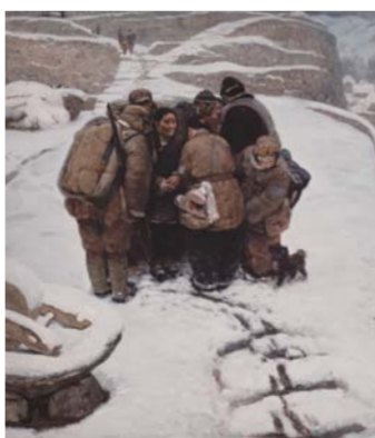
△王沂东 《给姑娘个信》 布面油彩 184×170cm 1982年 中央美术学院美术馆藏