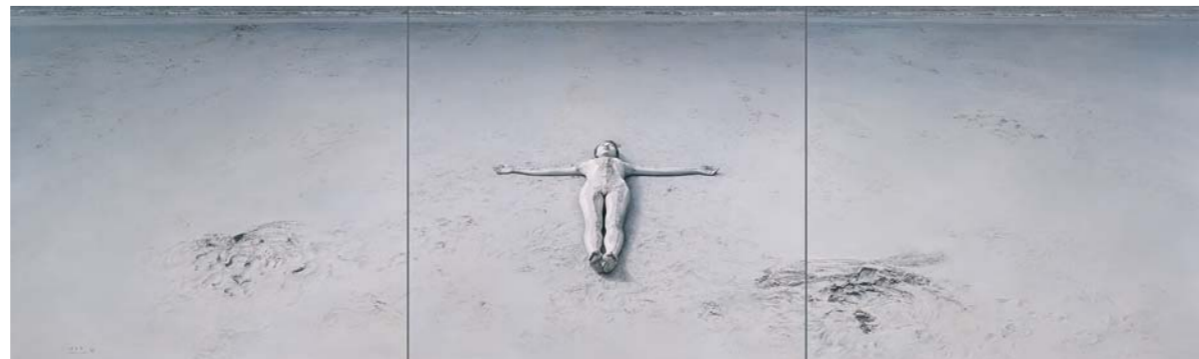
△徐青峰 《空》 170×450cm 布面油画 2006年9月 自藏