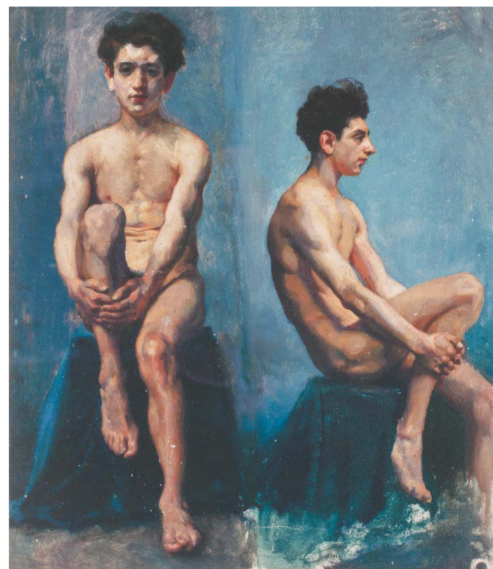
△徐悲鸿 《男人体正面速写》 布面油画 52×44cm 约1924年 中央美术学院美术馆藏