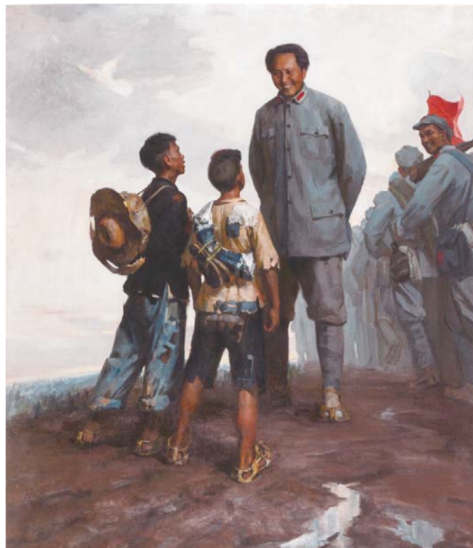
△蔡亮 《贫农的儿子》 布面油画 210×176cm 1964年 中国美术馆藏

据悉，2016年6月，“历史的温度：中央美术学院与中国具象油画”展将于山东美术馆正式展出。