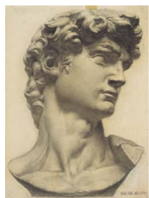
△喻红 《大卫》 素描 100×73cm 1984年