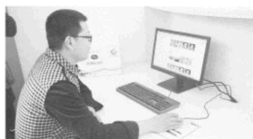
△“互联网+农业”概念将万德特产、风景名胜、采摘、旅游等活动尽情展示,让消费者充分体验线上消费+线下体验新玩法。

万德镇通过“党支部+合作社+电商平台”的模式,即党支部引领、合作社主营、电商平台服务,将党组织优势转化成产业经济发展优势,实现党支部谋富、合作社促富、电商平台带富,带动村集体经济发展和农民增收致富。