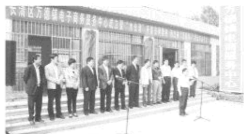
△随着济南市第一家乡镇电商服务平台的成立,长清区万德镇开始拓展“云市场”。

此次活动拉开万德镇农村发展、农民增收致富新模式,在大数据时代背景下,农产品网上销售开启农业物联网实践,对万德樱桃、西红柿等农产品的品牌推介、包装、销售起到极大促进作用,拓宽了农业生产信息渠