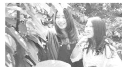
△青山绿水郁葱葱,满树樱桃叶底红。长清区万德镇鲜艳欲滴的“红玛瑙”将成为网络新宠。

此次樱桃、西红柿、乡村旅游“互联网+”活动首次引入“互联网+农业”概念,主题为“五月好去处,尽在樱桃园”“万德樱桃西红柿O2O,引领群众快致富”“发展乡村旅游,建设生态万德”,着眼于生态旅游、“互联网+”农业发展新模式,突出生态万德,结合万德特产、风景名胜、采摘、旅游等活动为消费者展示万德之美,通过O2O相结合,体验线上消费+线下体验新玩法。游客通过“生态万德”微信平台、依安网的万德主题页面,不仅可以线