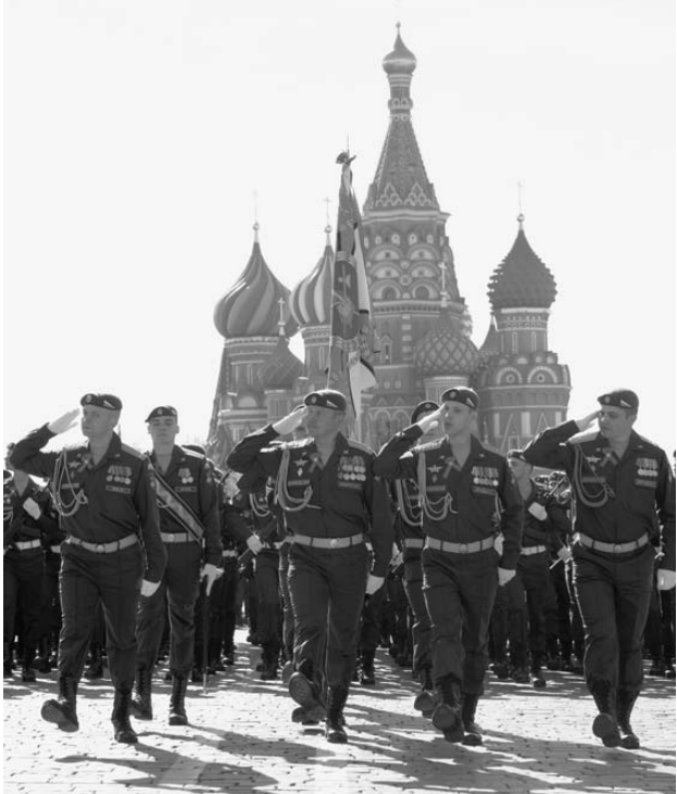
莫斯科举行纪念卫国战争胜利70周年阅兵式总彩排