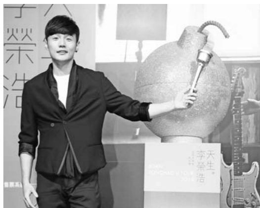
5月5日,歌手李荣浩在台北举行“2015天生李荣浩巡回演唱会-台北站”记者会,宣布将于7月11日在台北国际会议中心开唱。

形势占优的全北现代队很可能会采用防守反击的战术,泰山队的防线必须要挡住对手的攻势,最好不要丢球。否则,急于进攻后防空虚的泰山队有再遭大败的危险。要真的如此,泰山队失去的可能就不只出线权那么简单了。