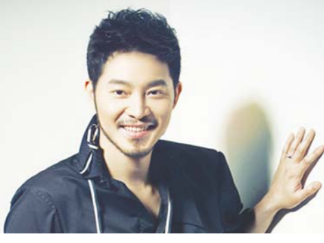
□ 本报记者 陈巨慧 实习生 曹火霞

由李玉执导,韩庚、范冰冰、沙溢(上图)领衔主演的电影《万物生长》正在热映,讲述青春的爱与痛,情与伤。片中,饰演解剖学老师的沙溢凭借精彩表现,为该片增加了不少幽默感。4月22日,沙溢接受本报记者独家专访。