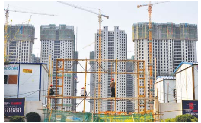
4月18日,日照市一处在建商业楼盘。 □CFP供图