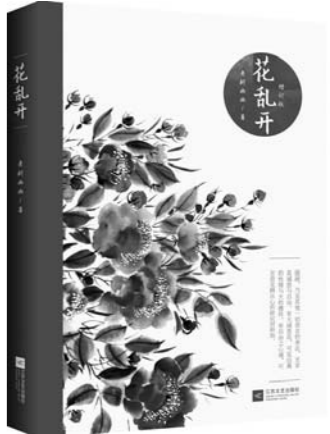
《花乱开》 老树画画 著 江苏文艺出版社

本书中，作者立足于中华传统文化和东方智慧这一独具中国特色的宝贵资源，运用其长期研究的链接与平衡理论，深入解读和探讨国家形象的塑造工程，以期为我国国家形象的提升提供不同视角的解读和建议。