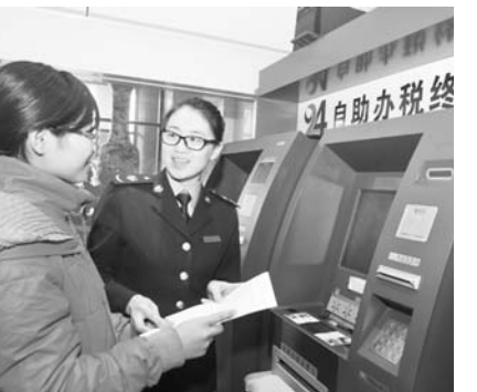
高新区国税局税收管理人员正指导纳税人使用自助办税机。

小微企业是经济发展的晴雨表、地方经济的活力器，受到全社会的广泛关注。国家相继出台了一系列税收优惠政策来鼓励和促进小微企业发展。但介于部分企业对政策掌握不全，或是办手续“怕麻烦”等原因，部分符合条件的小微企业并没有主动享受税收优惠政策。 高新区国税局把落实小型微利企业优惠政策作为紧要任务，通过采取一系列措施，积极向小微企业落实优惠政策，让纳税人实实在在地享受到政策红利。